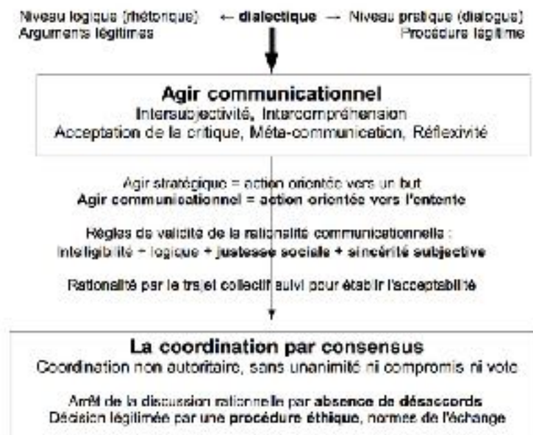
Figure 1. De l'Agir communicationnel à la coordination par consensus

Duchamp et Koehl 2008) : on peut parler d'un paradigme « procéduraliste » de la décision. En pratique, un choix collectif est bien sûr soumis aux biais classiques de tout processus de décision (coût de la recherche d'information, coût cognitif, coût stratégique, biais du conformisme, biais de l'ancrage...) et il est d'autre part pratiquement impossible de poursuivre une discussion jusqu'à ce qu'un consensus général soit atteint, mais l'essentiel est que la décision finalement prise soit légitimée par une procédure éthique : ce qu'on appelle « les faits » ne sont pas indépendants du choix collectif, mais ils en deviennent un résultat provisoire, un résultat qui est présumé rationnel par tous car il a été généré à travers l'échange des représentations, et un résultat que la réflexivité permet toujours de rectifier dans une discussion ultérieure.